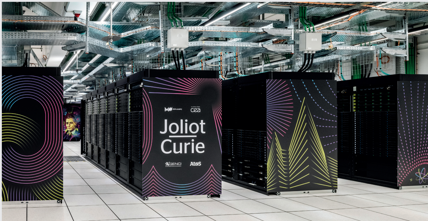
Hébergé au TGCC du CEA sur la Technopole Teratec, le supercalculateur Joliot Curie répond aux besoins des communautés de recherche nationales et internationales.