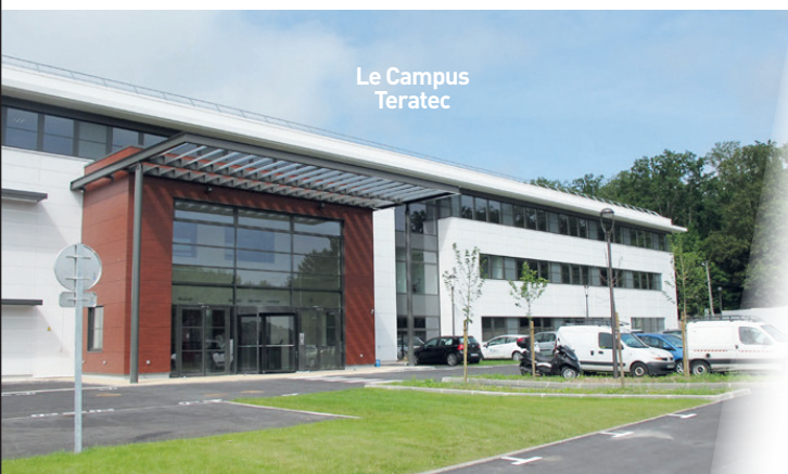
Le Campus Teratec